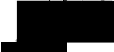
Network Capacity Manager